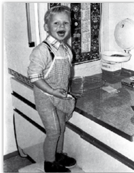
Vorfreude beim Plätzlebacken

Wenn süße Düfte aus der Küche das Haus durchziehen, dann ist bald Weihnachten! So haben es jedenfalls viele in Erinnerung, denn die weihnachtliche Vorfreude war vor allem mit schmackhaften Backwaren verbunden. Auch heute gehört die Mithilfe beim Plätzchenbacken in der Familie für viele Kinder zu den stimmungsvollen Erlebnissen. Lebkuchen, Stollen, Hutzelbrot vor allem Plätzle und Springerle gab es früher ausschließlich in der Weihnachtszeit. Gelegentliche Kostproben (Versucherle) überbrückten das sehnsuchtsvolle Warten auf das Christkind.