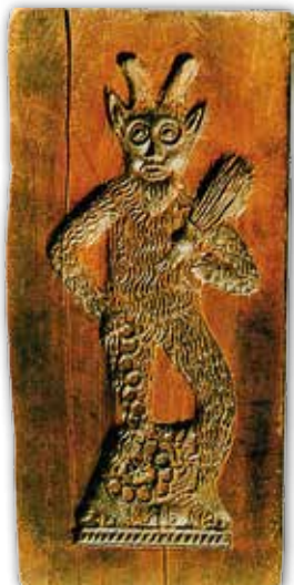
Holzmodell einer Krampusfigur, Begleiter des Hl. Nikolaus

Das wichtigste Weihnachtsgebäck waren in unserer Gegend Jahrhunderte lang die Lebkuchen, deren Herstellung und Verkauf in Augsburg seit dem späten Mittelalter nachgewiesen sind. Die „Lebküchener“ waren ein eigenständiges Gewerbe innerhalb der Bäckerzunft, deren Arbeit mit der Einführung der Gewerbefreiheit 1870 von Konditoren übernommen wurde.