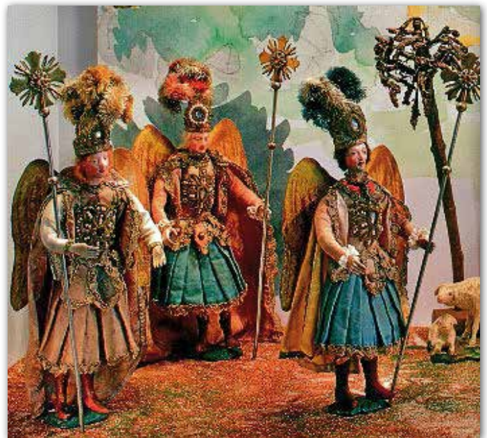
Heroldengel mit goldbestickten Gewändern und federgeschmückten Kopfbedeckungen, Ottobeuren, 18. Jh.