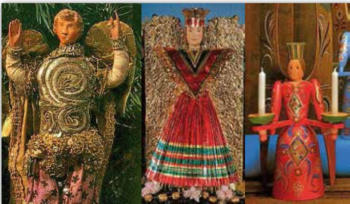
Von links nach rechts: Verkündigungengel, Augsburg, 18. Jh. Nürnberger Rauschgoldengel mit Krone, Schultertuch und Papierkleid, 19. Jh. Berchtesgadener Leuchterengel, gedrechselt und farbenprächtig bemalt, 20. Jh.