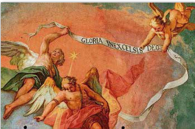
Verkündigungengel, Ausschnitt des Deckenfreskos in der Klosterkirche Oberhöfen, 18. Jh.