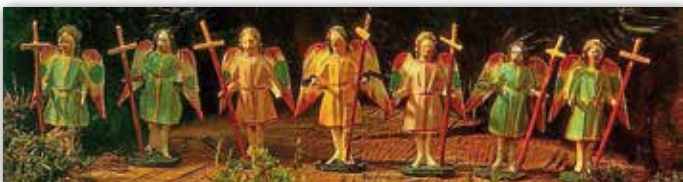
Oberammergauer Engelspalier, 19. Jh.